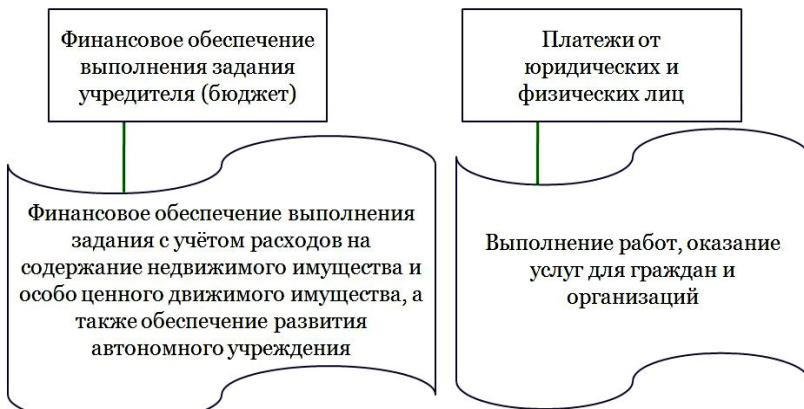
Рисунок 4 – Формирование доходов автономного учреждения

Учредитель осуществляет финансовое обеспечение выполнения задания с учетом расходов на содержание недвижимого имущества и особо ценного движимого имущества, закрепленных за автономным учреждением учредителем или приобретенных автономным учреждением за счет средств, выделенных ему учредителем на приобретение такого имущества, расходов на уплату налогов, в качестве объекта налогообложения по которым признается соответствующее имущество, в т. ч. земельные участки, а также финансовое обеспечение развития автономных учреждений в рамках программ, утвержденных в установленном порядке. В случае сдачи в аренду с согласия учредителя недвижимого имущества или особо ценного движимого имущества, закрепленных за автономным учреждением учредителем или приобретенных автономным учреждением за счет средств, выделенных ему учредителем на приобретение такого имущества, финансовое обеспечение содержания такого имущества учредителем не осуществляется.