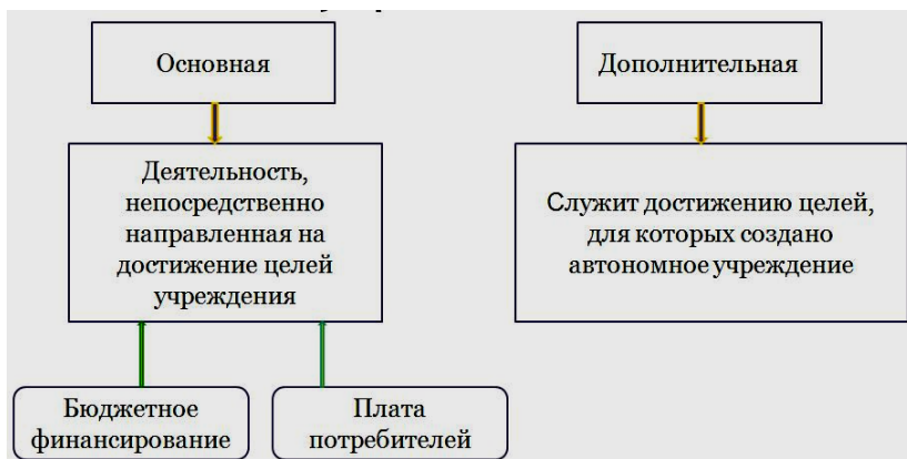
Рисунок 3 – Виды деятельности автономного учреждения

соответствии с утвержденной им сметой доходов и расходов. Учреждение получает выделяемые ему по смете денежные средства в соответствии с процедурой, установленной бюджетным законодательством, т. е. путем регулярных ассигнований, поступающих на лицевой счет учреждения в казначействе.