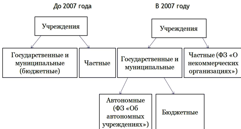
Рисунок 1 – Новая система учреждений

науки, образования, здравоохранения, культуры, социальной защиты, занятости населения, физической культуры и спорта, а также в иных сферах».