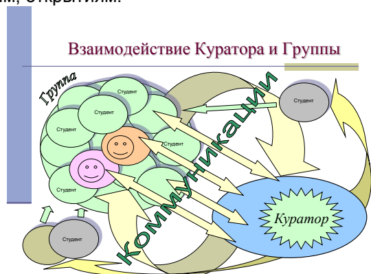
Рисунок 1 – Взаимодействие куратора и группы

Основным направляющим звеном между первокурсниками и вузом является куратор, задачей которого является налаживание коммуникаций и создание с опорой на студенческое самоуправление условий для профессионально-социального становления и стремления к новым знаниям, впечатлениям, открытиям.