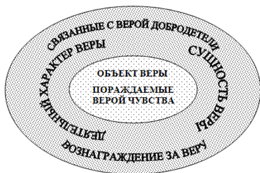
Рис. 2 – Когнитивные признаки концепта FAITH (ядро и периферия)

Лингвокогнитивный анализ позволил выделить такие значимые для респондентов когнитивные признаки концепта, как объекты веры, порождаемые верой чувства, сущность веры, деятельный характер веры, связанные с верой добродетели, вознаграждение за веру (рис. 2).