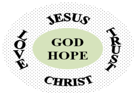
Рис. 1 – Ядерная зона концепта FAITH

Лингвокогнитивный анализ позволил выделить такие значимые для респондентов когнитивные признаки концепта, как объекты веры, порождаемые верой чувства, сущность веры, деятельный характер веры, связанные с верой добродетели, вознаграждение за веру (рис. 2).