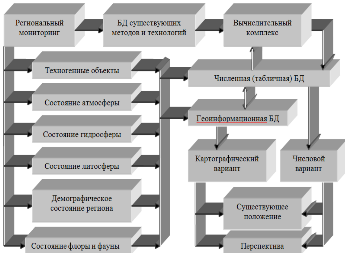
Рисунок 3 – Структура системы поддержки принятия решений

СППР должна иметь динамическую база данных по количеству и видам выбросов и отходов, физическому воздействию промпредприятий на окружающую среду; базу данных по существующим природосберегающим технологиям; базу данных по демографическому состоянию региона.