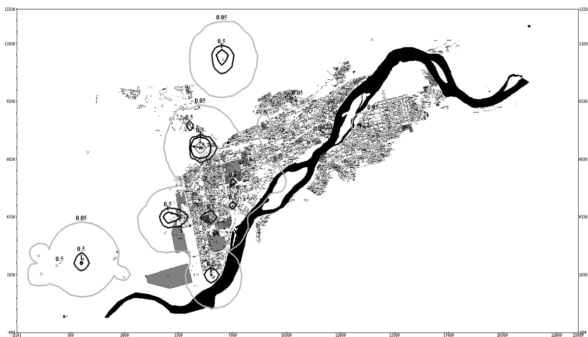
Рисунок 2 – Уровень загрязнения атмосферы взвешенными веществами после предложенных мероприятий