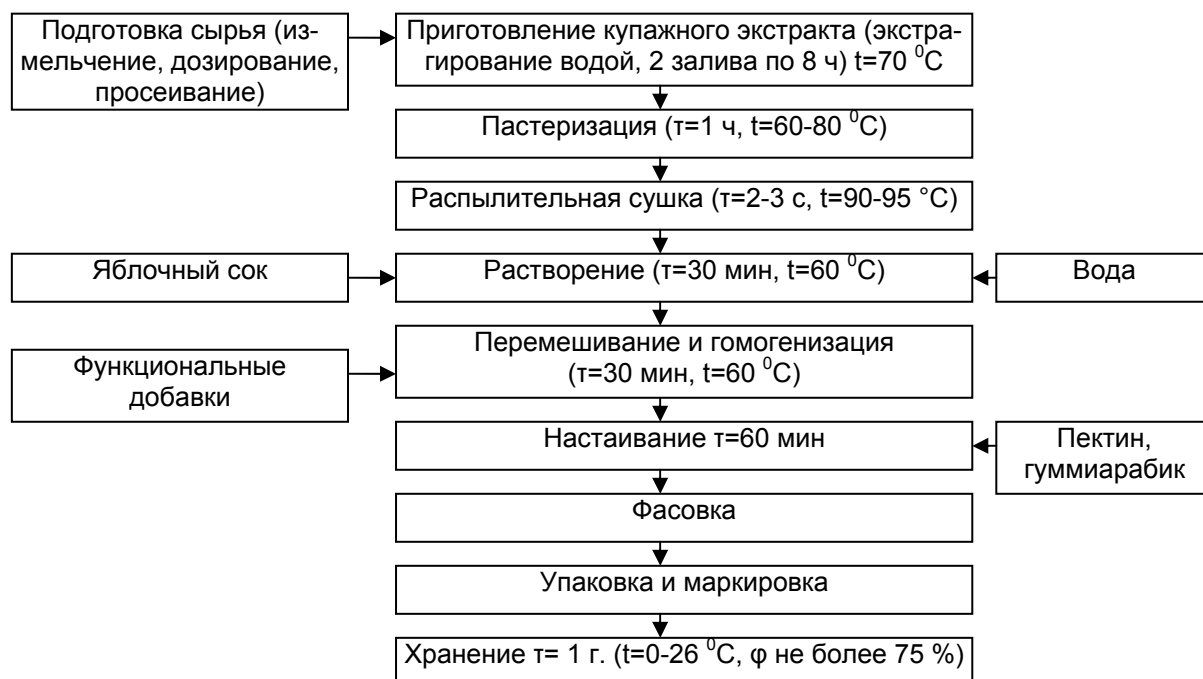
Рисунок 1 – Технологическая схема производства БАД «Урогель»

Технологическая схема производства разрабатываемого БАД дана на рисунке 1.