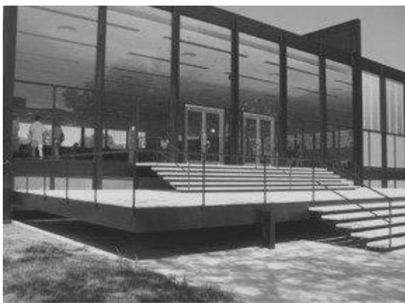
Рисунок 2 - Мис ван дер Роэ, Краун-холл (S. R. Crown Hall) в Институте технологии Иллинойса

• Геометрически простая форма выражалась через рациональное конструктивное решение, отсутствие деталей и элементов мелкого масштаба в виде декоративных элементов, орнамента, украшений, однородные (гомогенные) поверхности, индустриальные материалы – черты, которые наиболее полно проявлены в объектах Ле Корбюзье, Мис ван дер Роэ, В. Гропиуса, К. Мельникова и др. (рисунок 2); они были заимствованы архитекторами-минималистами и отражены в архитектуре Минимализма в 80-е годы XX века и не менялись вплоть до настоящего времени. В настоящее время в объектах минимализма идея минимизации в основном выражается через моноформу с гомогенными поверхностями.