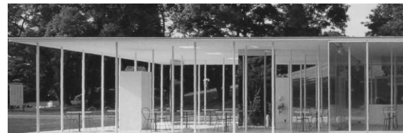
Рисунок 5 - SANAA Kazuyo Sejima + Ryue Nishizawa, Park Cafe, Кода, Ibaraki, Japan 1996-98

образование структуры системы с целью уменьшить число входящих в них элементов или упростить связи между этими элементами), которая становится способом проектного действия (основное проектное действие - минимизация) при проектировании архитектурных объектов Минимализма. Идея минимизации направлена на трансляцию новых социальных ценностей, внедряемых в сознание человека, через архитектурные объекты Минимализма. Это и минимизация границ в объекте, и минимизация функций, и минимизация форм и фактур, выраженная разными способами («минимизация как максима» - достижение минимума или приведение к нему как основное правило поведения, принцип) (таблица 1, рисунки 4, 5).