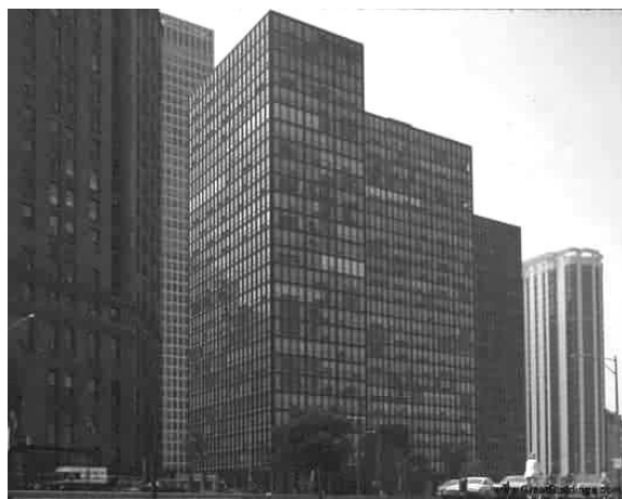
Рисунок 1 - Мис ван дер Роэ, Комплекс на Лейк Шор Драйв (Lake Shore Drive Apartments), Чикаго, 1948

Все эти «каноны», как объединяющие принципы (по А.В. Иконникову), можно проследить и в минималистической архитектуре, что роднит ее с архитектурой модернизма (рисунок 1).