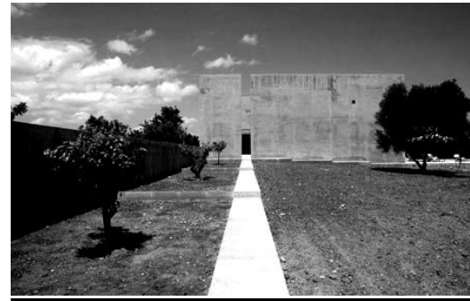
Рисунок 4 - Джон Павсон – Клаудио Сильвестрин, Neuendorf house, 1989 г.

Таблица 1 - Черты модернизма, японского традиционализма и современной японской архитектуры (50-70-х гг.) и их трансформация в Минимализме