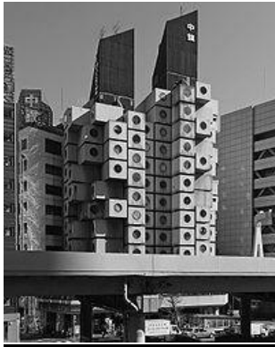
Рисунок 3 - Башня "Капсула" в Токио, Кисе Куракава, 1972 г.