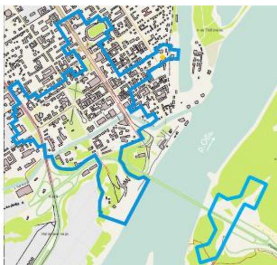
Рисунок 1 - Местоположение туристско-рекреационного кластера

7. (5б) Музейно-туристический комплекс «Улица Льва Толстого».