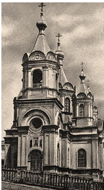
Рисунок 3 - Владивосток. Свято-Успенский кафедральный собор. 1886-1889 гг. Общий вид. Фотография 1900-х гг.

(В центрах других сибирских (восточно-сибирских) православных епархий во второй половине XIX – начале XX в. новые крупномасштабные кафедральные храмы не возводились и, скорее всего, даже не проектировались. Функции кафедрального храма Якутска после учреждения в 1869 г. Якутской епархии, по некоторым данным, были приданы Спасо-Преображенской церкви (построена в 1846 г.). Статус кафедрального собора Благовещенской епархии к началу советской эпохи имел деревянный храм во имя Благовещения Пресвятой Богородицы, задолго до его разрушения при пожаре (1924 г.) рассматривавшийся православной общественностью Благовещенска как технически и эстетически несовершенный, в связи с чем предполагалось строительство нового здания кафедрального собора [7].)