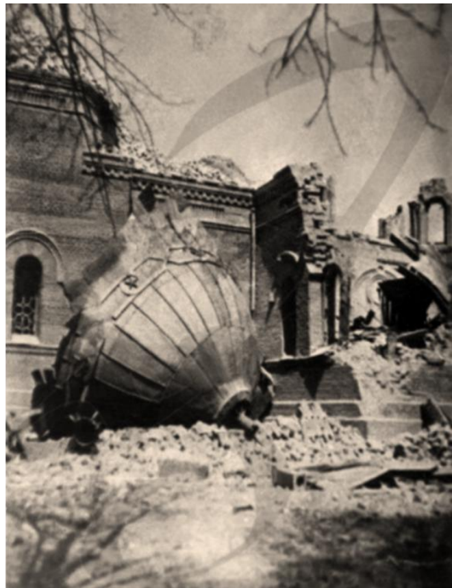
Рисунок 2 – Чита. Свято-Александро-Невский кафедральный собор после подрыва. Фотография 1936 г.

Во Владивостоке в конце XIX в. новым главным (кафедральным) храмом Владивостокской православной епархии, образованной при разделении Камчатской епархии 4 июня 1898 г., стал пятиглавый (пятишатровый), сращенный в основном его объеме с монументальной шатровой колокольней, активно формировавшей главный (западный) фасад храмового ансамбля, нарочито эклектичный в выразительном барочно-классицистическом декоре экстерьера Свято-Успенский собор (заложен 14 августа 1876 г.; строился в период с 1884 по 1889 г.; освящен 6 декабря 1899 г.; получил статус кафедрального храма 8 февраля 1899 г.), близкий по своему общему архитектурно-художественному решению (в рамках «русского» стиля, сложившегося и развивавшегося в составе национального направления русской архитектурно-художественной эклектики наряду с уже упоминавшимся в настоящей работе «византийским» и «русско-византийским» стилями) к Богородице-Рождественскому кафедральному храму в