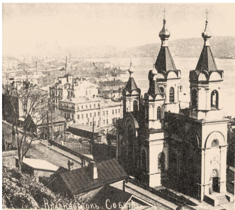
Рисунок 4 - Владивосток. Свято-Успенский кафедральный собор. 1886-1889 гг. Общий вид. Фотография 1900-х гг.